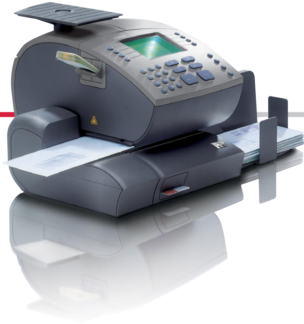
Frankiermaschine ultimail 45