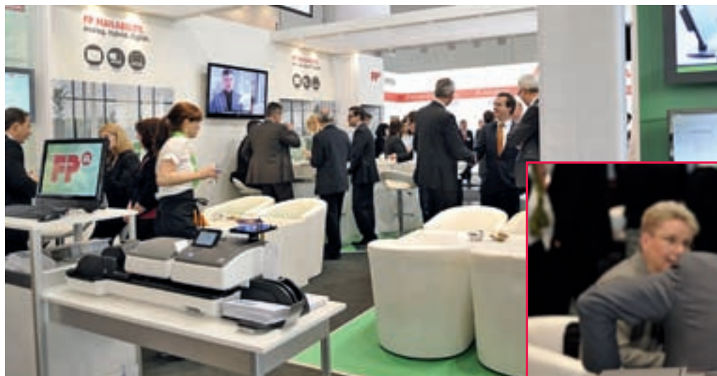
AB DIE POST! Optimierungsmöglichkeiten für die ganzheitliche Postbearbeitung präsentiert Francotyp-Postalia auf der kommenden CeBIT in Hannover.