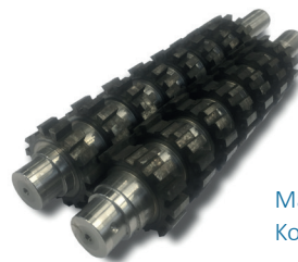
Mahlwerke aus gehärtetem Kohlenstoffstahl