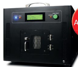
Der Kobra HDD kann auf Anfrage mit einem von der NSA zugelassenem Festplatten-Entmagnetisierer geliefert werden