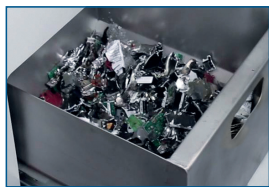
Einfache Entnahme des geschredderten Materials