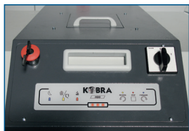
Einfache Bedienung über Touchboard