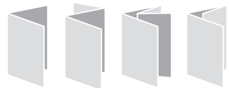
Einfachfalz, Zickzackfalz, doppelter Parallelfalz und Wickelfalz