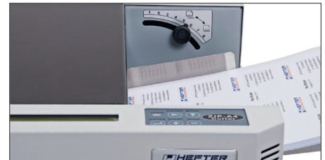
Einfache Bedienung und individuelle Einstellung der Papierstärke