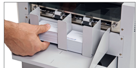
Universell einstellbare magnetische Ablage