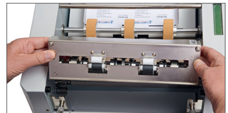
Die Messerkassette kann sehr einfach entnommen und gewechselt werden z.B. für Perforier- oder Rillmesser